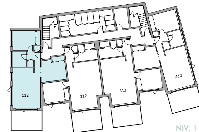
NIV. 1 (REZ-DE-JARDIN)